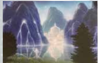
Bilder aus dem Kartendeck „Verborgene Welten: Botschaften aus dem Licht“ von Gilbert Williams

Teil 1: Freitag, 20. September bis Sonntag, 22. September 2024 jeweils 10.00 – 17.00 Uhr Teilnahmegebühr Euro 390,- Wiederholer Euro 150,-